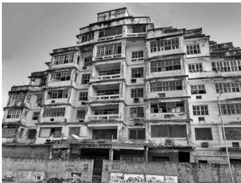
Figura 3 – Fachada do Edifício São Pedro.