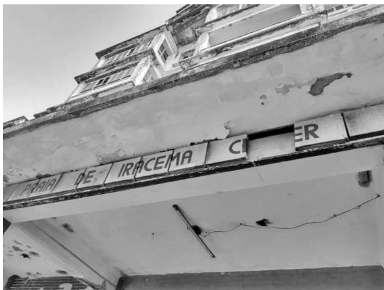
Figura 4 – Letreiros da Fachada decaída do Edifício São Pedro.